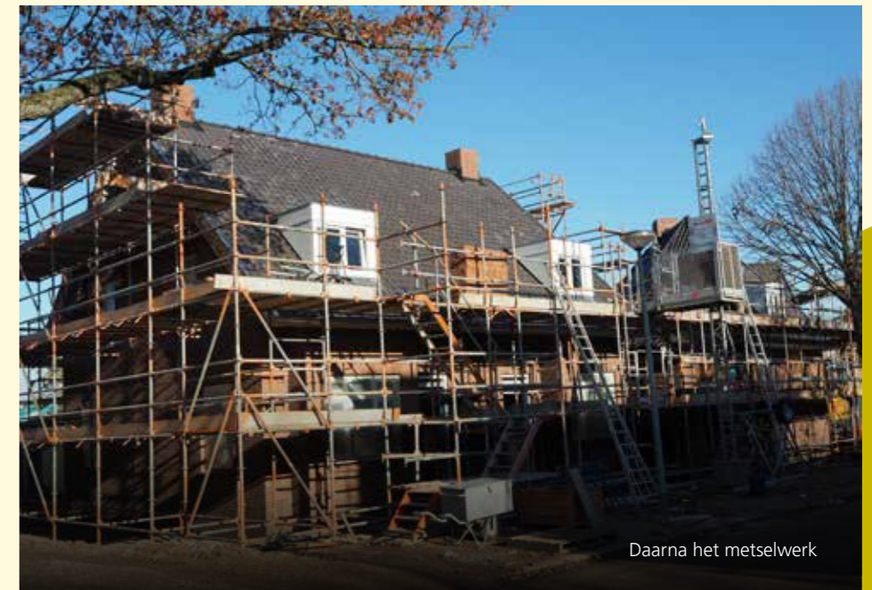
Daarna het metselwerk