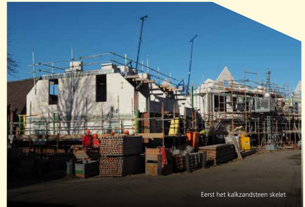
Eerst het kalkzandsteen skelet

Op bladzijde 4-5 vindt u een overzicht van de nieuwbouw in fase 2 & 3.