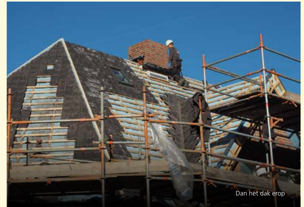
Dan het dak erop